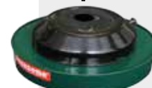
Paraffin-Heizung (Best.-Nr. 101.0550)