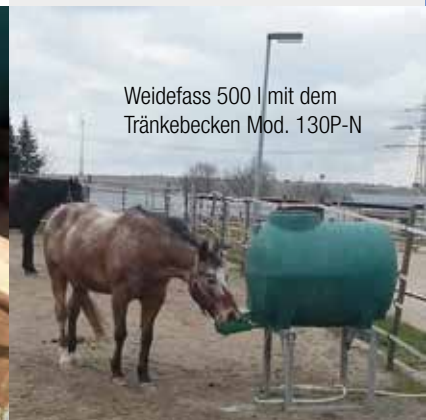
Weidefass 500 l mit dem Tränkebecken Mod. 130P-N