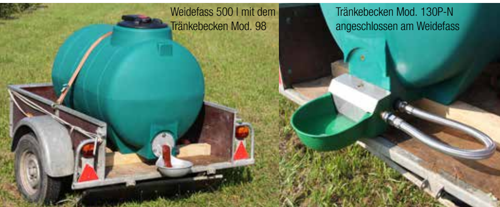
Weidefass 500 l mit dem Tränkebecken Mod. 98