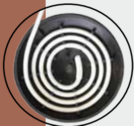
Ansicht Spezial-Gummiaufnahme von innen